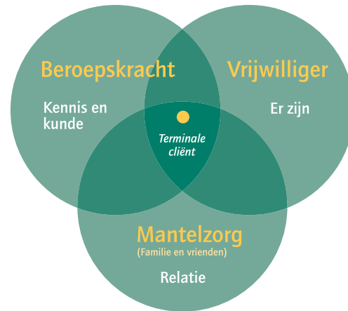
Figuur 1: Gemeenschapszorg

Wie ben ik in relatie tot de stervende mens?